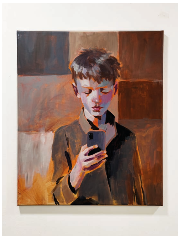
Mathieu Parisot, Boy , 2026 Acrylique sur toile 54 x 65 cm Oeuvre unique, signée © Art'Gentiers